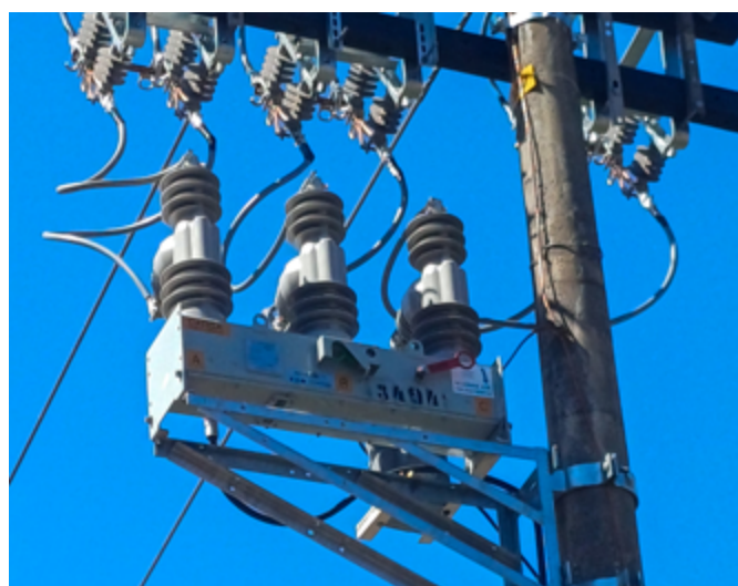
Chave de operação à distância instalada, do circuito H2