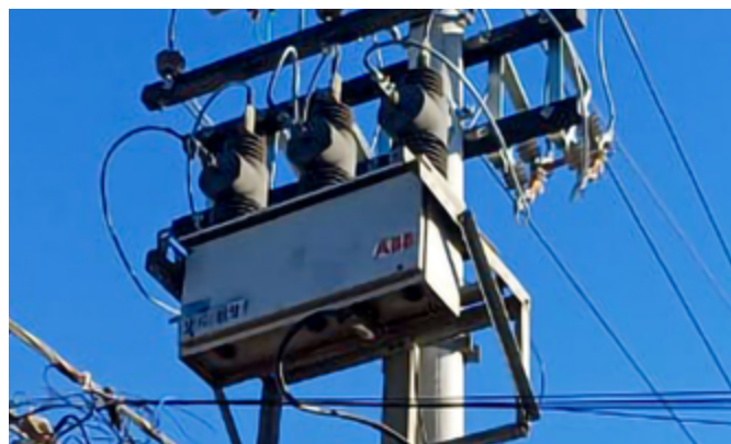
Religador em frente ao Deocleciu's

Também foi instalado novo equipamento religador no circuito H4, em frente ao Deocleciu's, para operação e proteção da rede de distribuição, para o loteamento das Chácaras Santo Antônio.