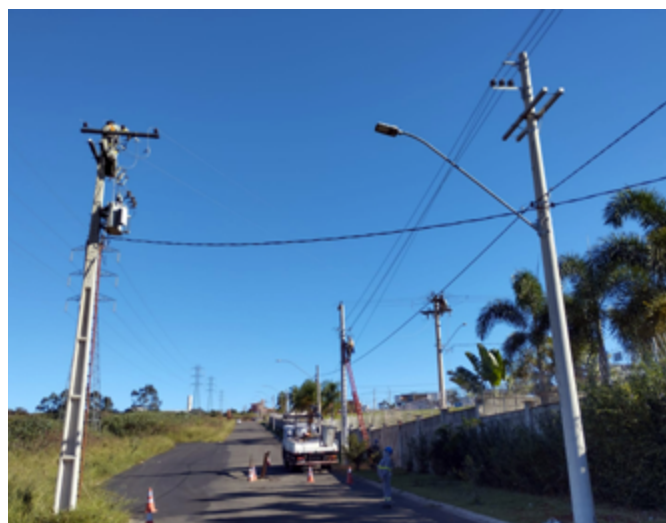
Obras na nova Avenida Atlântico (avenida das torres)