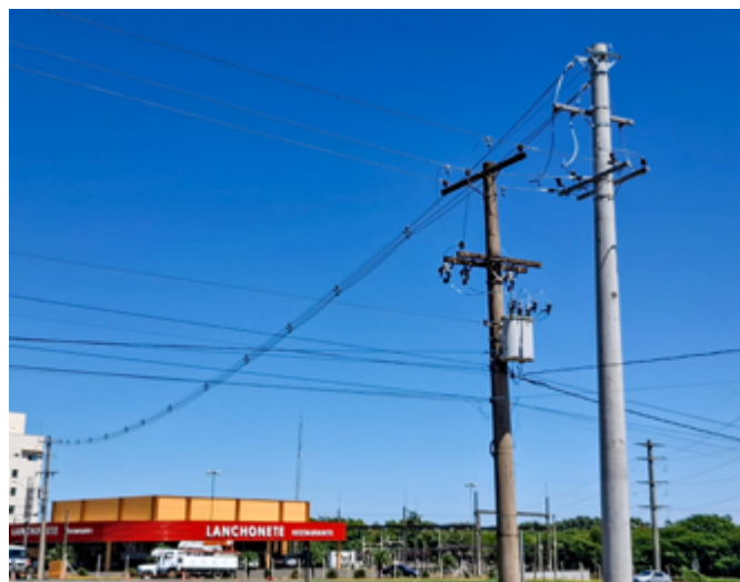
Nova rede elétrica sob a travessia da rodovia SP-340

Foi realizado também uma melhoria da rede elétrica na rodovia Luís Gonzaga de Amoedo Campos (estrada da Cachoeira), em Mogi Mirim, ocorrendo a instalação de novos condutores do tipo rede compacta, com uma maior capacidade de condução para atender o crescimento do bairro Cachoeira. Na mesma localidade, foi construído um novo trecho de rede de elétrica, na nova avenida Atlântico (avenida das Torres), para agilizar o sistema operacional da região.