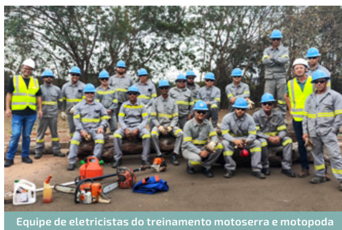
Equipe de eletricitistas do treinamento motosserra e motopoda

Os treinamentos e reciclagens realizados foram: Brigada de incêndio, Operador de Munck, Operador de motosserra e motopoda, NR12 Cesto Aéreo, Cibersegurança, Sistema Elétrico Potência.