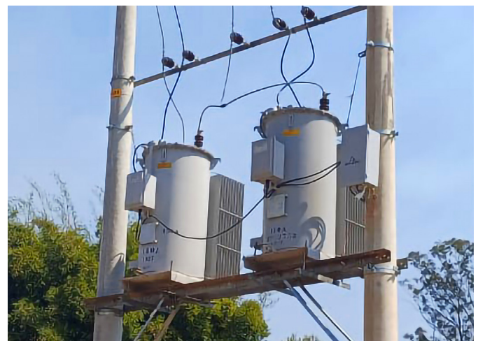
Novos reguladores de tensão