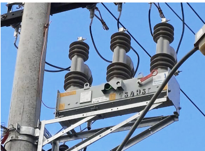
Chave automática, de operação à distância

Uma nova banca de reguladores de tensão foi adquirida, para o circuito de São João da Glória, em Mogi Mirim, com o objetivo de manter os níveis de tensão adequados aos consumidores e assegurar a estabilidade no fornecimento, principalmente em casos de transferência de cargas do circuito de Engenheiro Coelho.