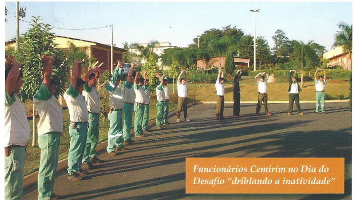
Funcionários Cemirim no Dia do Desafio "driblando a inatividade"

Uma profissional da área de Educação Física instruiu