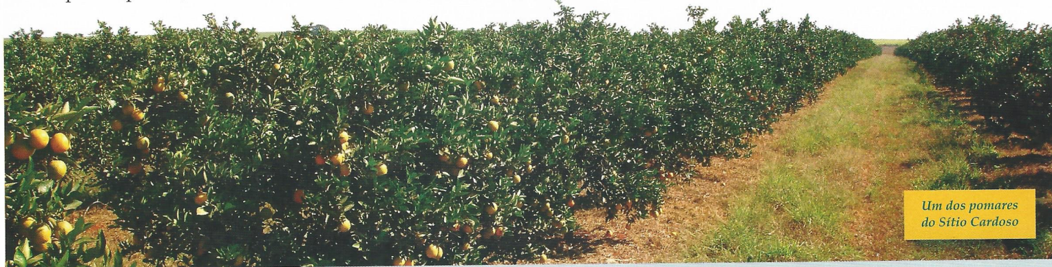
Um dos pomares do Sítio Cardoso

O Jornal Cemirim é um informativo da Cooperativa de Eletrificação e Desenvolvimento da Região de Mogi Mirim